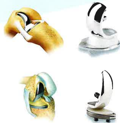
〈人工膝関節(単顆置換)イメージ〉

今回は膝で一番多い疾患、変形性膝(ひざ)関節症、 なかでも当院で多く行われている、UKA手術について説明します。