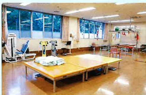
〈運動器リハビリ室〉