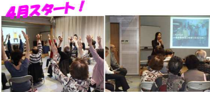
帯山校区には、全町内にサロンができました～！

初回は、35名程の参加がありました♪内容としては、『いきいき百歳体操』を中心に、介護保険制度の改正についての講話や脳トレが行われました。最後は茶話会♪たくさんおしゃべりして、身体も心もス〜ッキリされたご様子でした♪