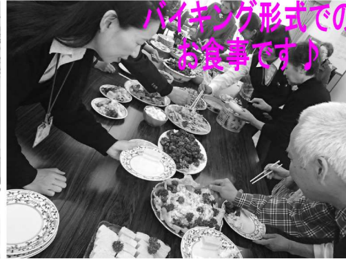
バイキング形式でのお食事です!