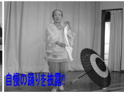
自慢の踊りを披露!