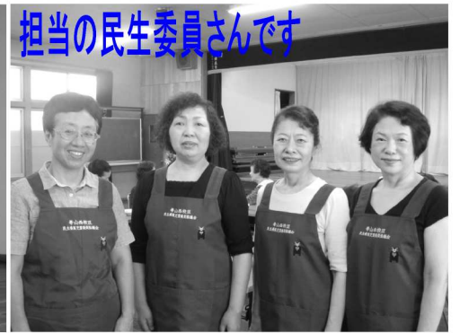
担当の民生委員さんです