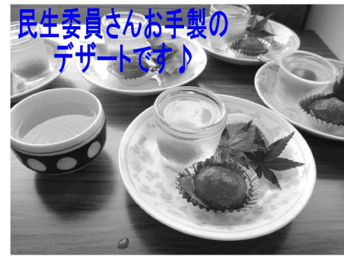
民生委員さんお手製のデザートです!

ます。また、参加者全員が必ず喋って帰るような雰囲気作りを心掛けておられ、この日初めて参加された方お二人に感想を尋ねたところ「不安だったが来て良かったです」と笑顔でお答え頂き、みんなが楽しく元気になる空間だと感じました。最後に民生委員さんから、地域の方々が気軽に集まれる場所が、今後各地域でもっとたくさん出来て欲しいとお話しされました。