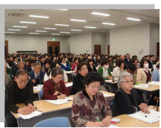
研修会の様子です。

今後もやすらぎの森では、認知症の啓発や地域でのネットワーク体制の構築を目指して、認知症のケアや予防等の多彩な研修会の開催を計画しておりますので、ぜひ参加してください。