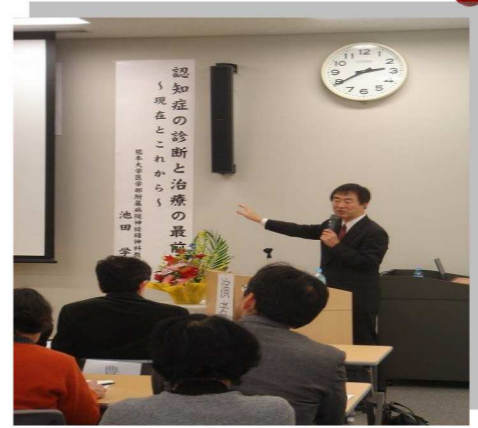
講師の先生方です。