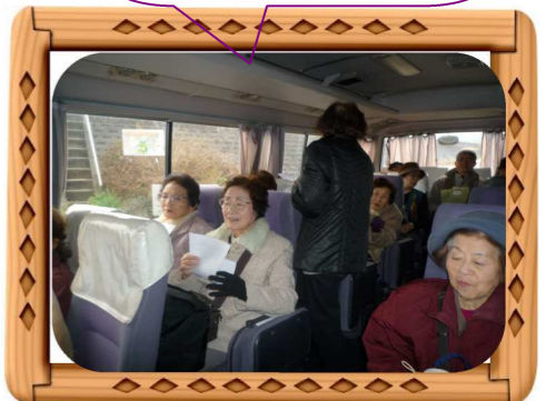
「フォレストすこやかクラブ」の皆さんです。