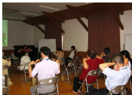
自宅でできる簡単な体操の指導がありました。