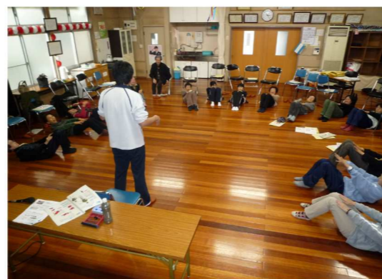
効果的な運動を指導していただきました。