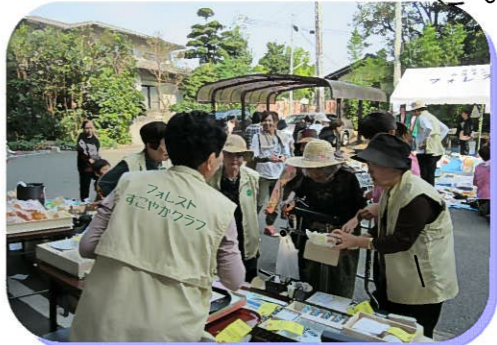
お揃いのベスト姿、皆似合ってます~o(*^▽^*)o♪

十月八日(土)すこやかクラブのメンバー(介護予防自主グループ)で販売し、楽しい一日を過ごされました。二万二千円ほどの活動資金が得られ、年末の忘年会、日帰りの温泉旅行などなど...。自分達で企画、計画、実行されるでしょう。これがまさに、介護予防ですね!