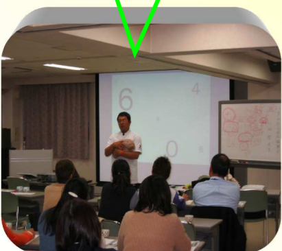
平成21年11月16日 フォレストホールにて

研修会には多数の事業所から参加いただきました。研修後も各事業所から、レクレーションやリハビリについてこれから取り入れることができるアイデアやヒントをお聞きしようという質問も多く出て活気ある研修会になりました。