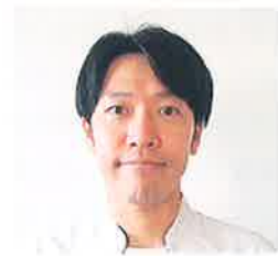
リハビリテーション科 言語聴覚士

年に数回しか連絡することもなくなっていた私と両親。突然届いた傘のプレゼントと手紙を両親はよろこんでくれたようで、珍しく父から絵文字入りの感謝のLINEが届きました。そのLINEには、嬉しそうにピンクの傘を広げた母の写真も載せられていました。親孝行できる貴重な機会をいただき、ありがとうございました。