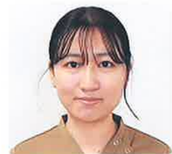
検査科 臨床検査技師

今では検査技師として江南病院で一生懸命働いている様子を話すなど、とても和やかな時間になりました。「このような企画もされる素敵な病院でこれからも日々精進し、患者様の為に全力を尽くしてください。」と応援の言葉をいただきました。いつも陰ながら支えてくれている家族に感謝の気持ちを忘れず、これからも頑張っていきたいと思います。