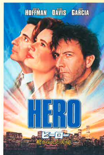
1992年製作 / 117分

そして誰の心にもヒーローがいて、誰かのためのヒーローであればよいのだ!ってことかな。おすすめですよ!